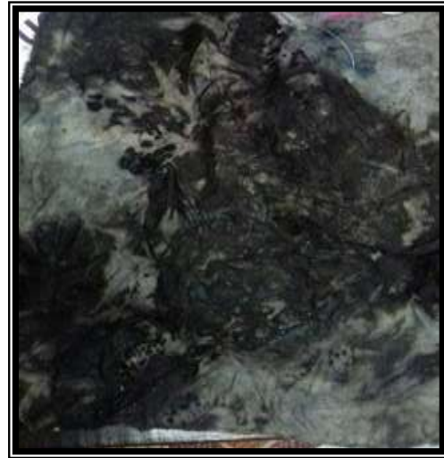
صورة رقم (٣)

ممارسات تطبيقية للباحث للحصول على نتائج للعقد والربط من خلال الصباغة بقشر الرومان والطينة السوداء وصدأ الحديد