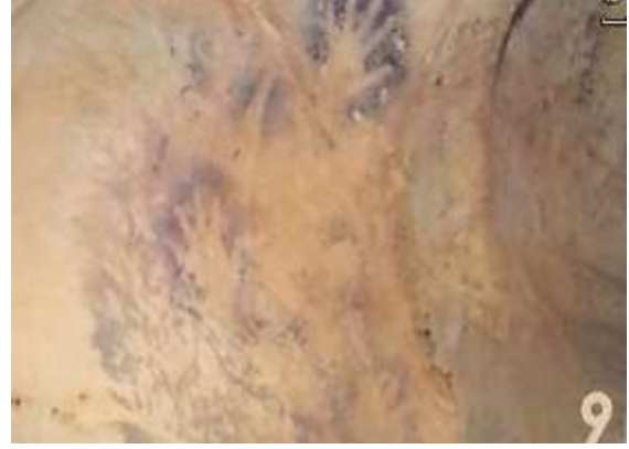
شكل رقم (١)

بعض البصمات للأيد مطبوعة بأكسيد صابغ من الطبيعة على الصخور "محمية الجلف الكبير بالفرافرة - كهف الابيض"