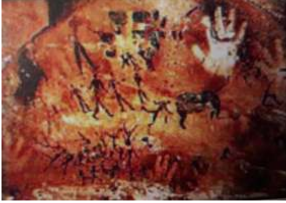
شكل رقم (٢)

المصرى فى هذه الواحات فوجدت بعض البصمات للأيد مطبوعة بأكسيد صابغ من الطبيعة على الصخور موجودة الى الآن (١) شكل رقم (١) وشكل (٢) .