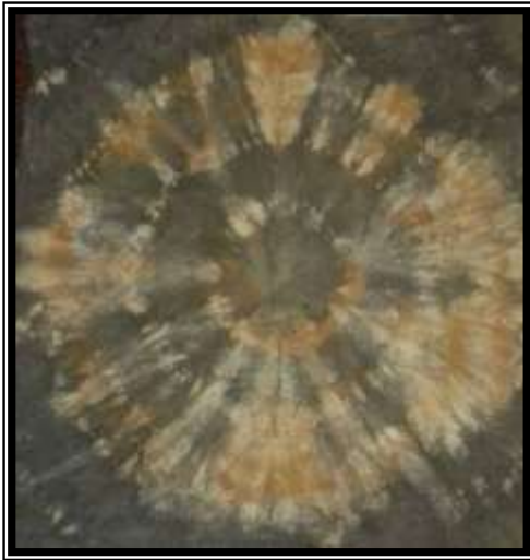
صورة رقم (٤)

تسمح للمنسوج بامتصاص اللون وتثبيتته. ثم يترك الزى ليجف . كما استخدم قشر الرومان المجفف في عملية الصباغة وتكسيهه بأحجام مختلفة ونثره على الثوب قبل طيه وعقده ، ودفن الثوب المراد زخرفته بالعقد والربط في الطينة السوداء ، لمدة ٢٤ ساعة وهذه الطينة لها مواصفات خاصة للحصول على لون اسود شديد السواد ، فكان يستخدم العيون الرومانية في عملية التصبيغ . وقد حصل على العديد من النتائج الغير متوقعة في هذه التقنية نتيجة تعدد الأحجام والأشكال لقطع الرومان المكسرة ، وصباغته على حسب كمية قشر الرومان الموضوعة على الزى ، واختلاف طرق العقد المستخدمة للمنسوج قبل صباغته ، كذلك أيضا اختلاف درجات صباغة المنسوج بقشر الرومان الفاتح والقاتم داخل الثوب المربوط ، وتعرض الطينة المباشر الذي يلامس الاجزاء المكشوفة للمنسوج باللون الاسود ، مما ينتج عنه اختلاف الدرجات اللونية للون الواحد والحصول على تأثيرات لونية مختلفة لدرجات اللون الواحد بالقطعة المصبوغة والعديد من الأشكال العشوائية المختلفة. شكل (٣) وشكل (٤).